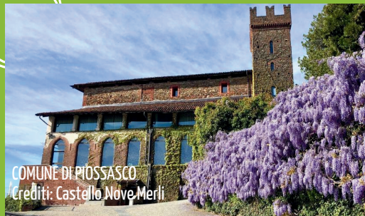
COMUNE DI PIOSASCO Crediti: Castello Nove Merli

UN NUOVO APPROCCIO ALL'ECONOMIA CIRCOLARE, PER RENDERE ANCORA PIÙ BELLE E PULITE LE NOSTRE CITTÀ!