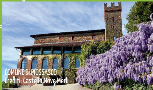
COMUNE DI PIOSASCO

UN NUOVO APPROCCIO ALL'ECONOMIA CIRCOLARE, PER RENDERE ANCORA PIÙ BELLE E PULITE LE NOSTRE CITTÀ!