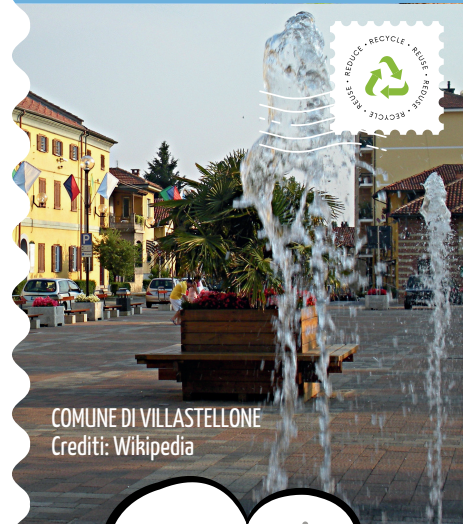
COMUNE DI VILLASTELLONE

PER MAGGIORI INFORMAZIONI CONSULTA "IL REGOLAMENTO DEI CENTRI DI RACCOLTA" SU WWW.COVAR14 O CHIAMA IL NUMERO VERDE CONSORTILE 800.639.639