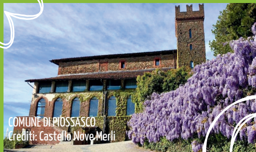
COMUNE DI PIOSASCO

UN NUOVO APPROCCIO ALL'ECONOMIA CIRCOLARE, PER RENDERE ANCORA PIÙ BELLE E PULITE LE NOSTRE CITTÀ!