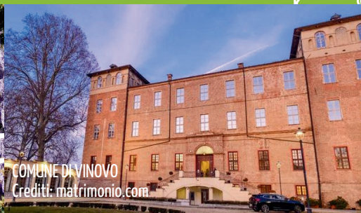
COMUNE DI VINOVO