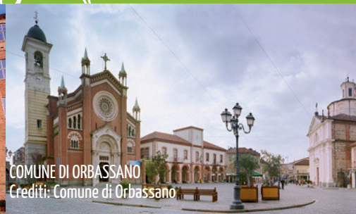
COMUNE DI ORBASSANO