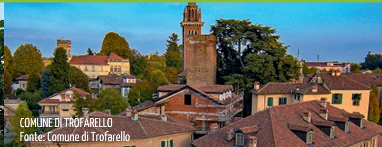
COMUNE DI TROFARELLO