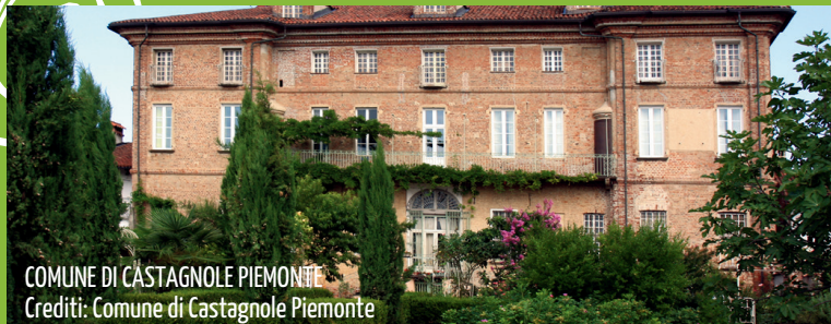
COMUNE DI CASTAGNOLE PIEMONTE